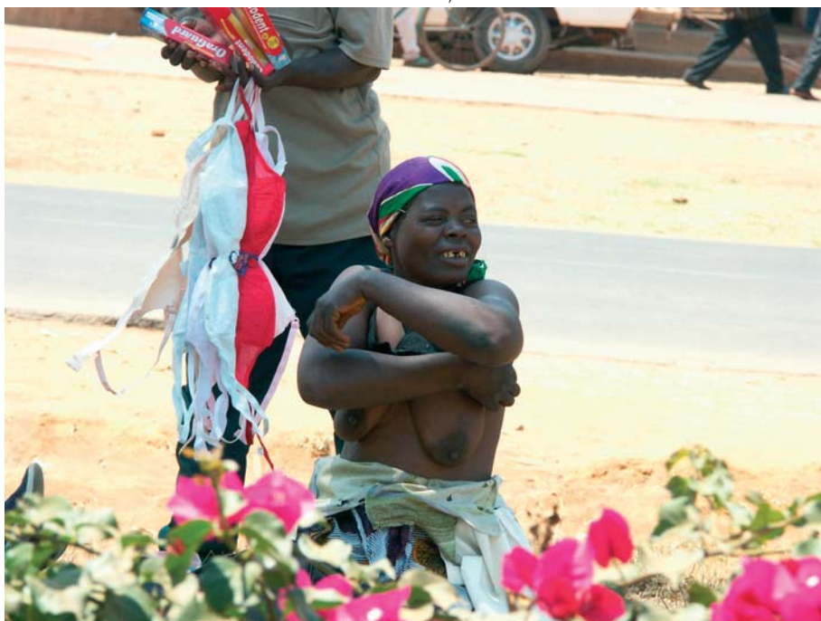
Lustiges Afrika, Anprobe in Malawi