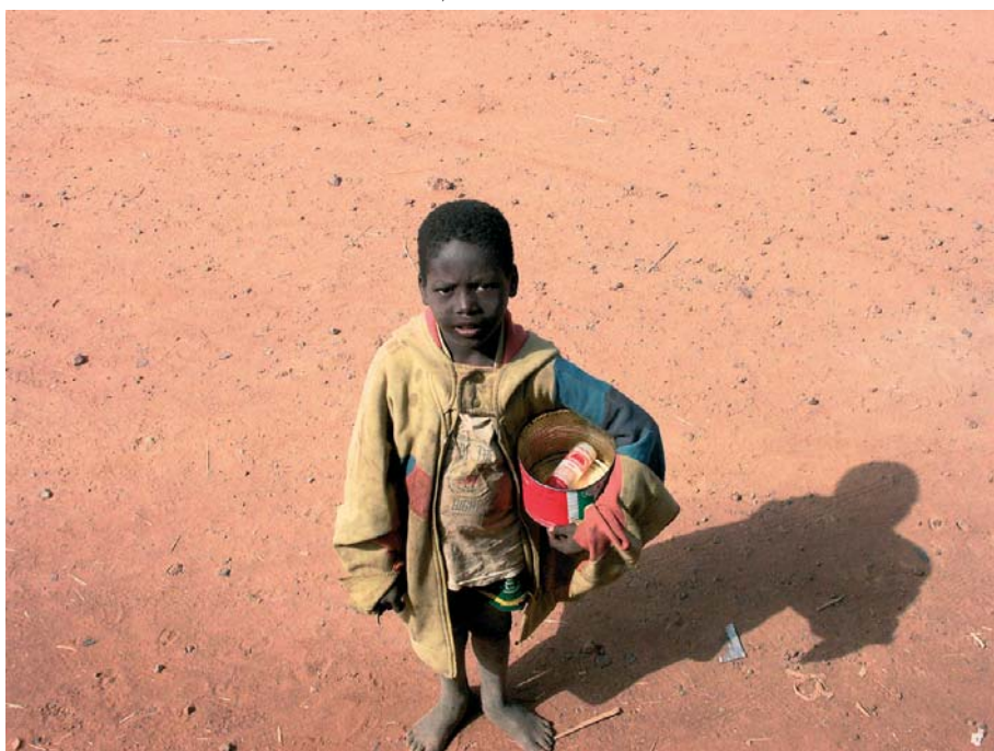
Trauriges Afrika, zu oft