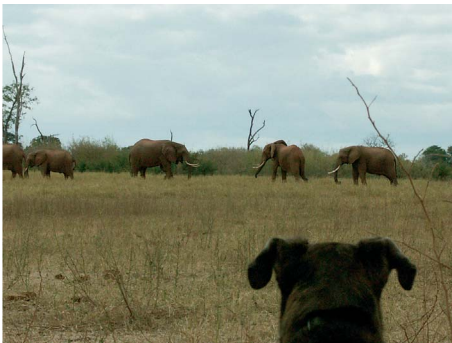
Traumhaftes Afrika, Simbabwe