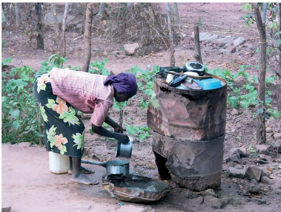
Armes Afrika, Küche in Burkina Faso